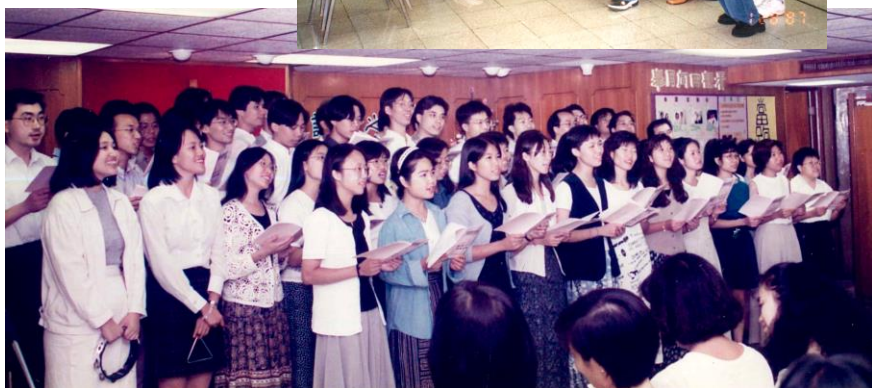
約瑟團詩歌分享會