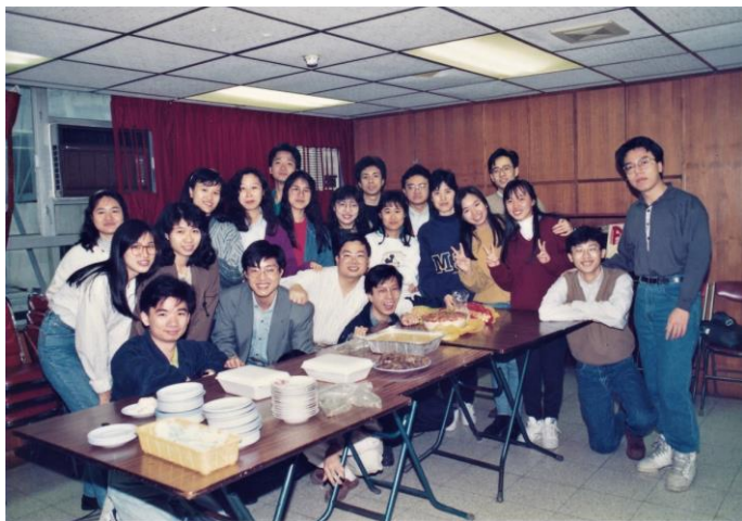
圖中的弟兄姊妹，你認識幾位呢？