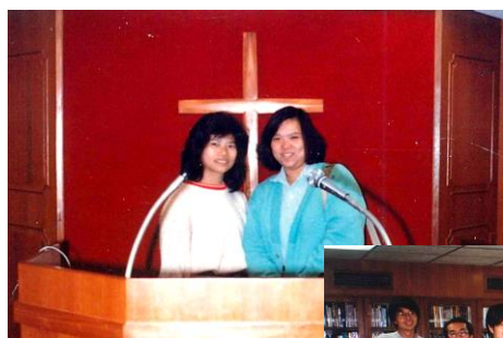
秀媚姊妹受浸記念

最後，我想分享幾張十浸8字樓的照片，當中見到教會的轉變，弟兄姊妹也成長了，神的恩典實在豐富。我十分期待在六月中旬教會裝修完畢後，一眾弟兄姊妹可以再次在這裏一同見證神、一同守望、一同祈禱、一同傳福音。願榮耀頌讚歸與我們在天上的父神。