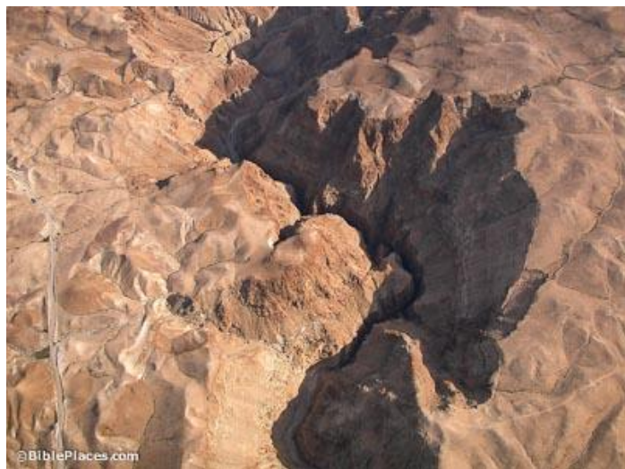
猶大曠野某個死蔭幽谷。